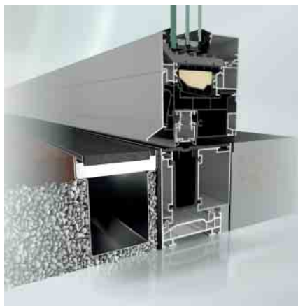
AWS 90.SI+ mit Nullschwelle AWS 90.SI+ with zero-level threshold

Barrierefreie Fenstersysteme sorgen für generationsübergreifenden Komfort. Insbesondere die Nullschwelle sorgt für ein ebenmäßiges Bild zwischen innen und außen. Diese Systemerweiterung erfüllt die ift-Richtlinie „Ermittlung und Klassifizierung der Überrollbarkeit von Schwellen (BA-01/1)“ und erreicht dabei die höchstmögliche Klassifizierung (Klasse 6). Dank unterschiedlicher Ausführungsmöglichkeiten der Schwelle eignet sich das barrierefreie System sowohl für den Neubau (80 mm) als auch für Renovierungsobjekte (50 mm). Die Absenkdichtung mit verzögerter hydraulischer Absenkung sorgt für einen kräftefreien Schließvorgang. Die integrierte Wasserrinne mit Rückschlagventil ermöglicht eine kontrollierte Entwässerung.