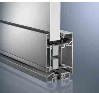
Schüco Tür ADS 70.HI Schüco door ADS 70.HI