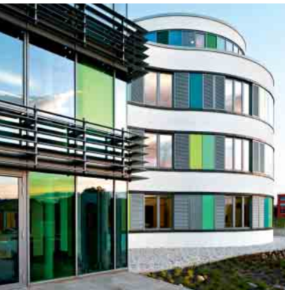
Schüco Aluminium-Türsystem ADS 70.HI Schüco Aluminium door system ADS 70.HI

Aluminium-Türsystem Aluminium Door System