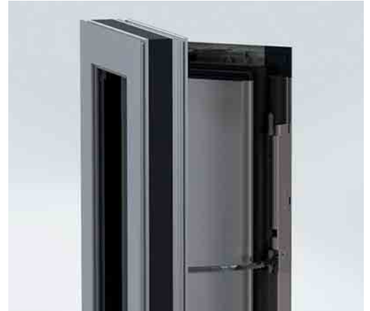
Lüftungsflügel AWS VV mit Schüco TipTronic Beschlag Ventilation Vents AWS VV with Schüco TipTronic fitting

Schüco Lüftungsflügel AWS VV (Ventilation Vents) sind als opake Drehflügel in 300 mm, 250 mm und 170 mm Ansichtsbreite verfügbar. Damit ist es Schüco gelungen, die mit 170 mm Ansichtsbreite weltweit schmalste Lüftungsklappe im Systemgeschäft zu realisieren. Die bis Raumhöhe realisierbaren Drehflügel kombinieren schnelle Raumdurchlüftung mit hoher architektonischer Gestaltungsfreiheit. Im Sommer können die Drehflügel dauerhaft geöffnet bleiben. Die Flügel sind komfortabel zu bedienen und eignen sich ideal zur Kombination mit großen verglasten Elementen und Festverglasungen.