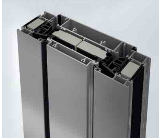
Horizontalschnitt durch den Lüftungsflügel Horizontal section detail through the ventilation vents