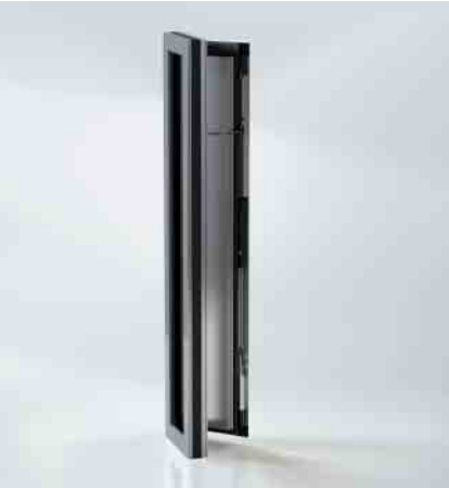
Es sind bis zu raumhohe Lüftungsflügel realisierbar Floor-to-ceiling ventilation vents are possible.