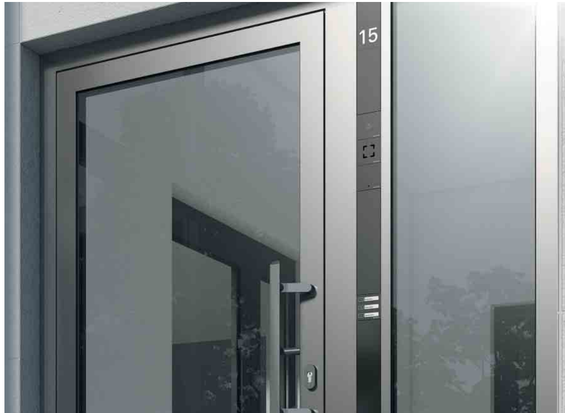
Hochfunktional, optisch attraktiv und effizient installiert: Schüco Door Control System (DCS) Highly functional, efficiently installed and visually attractive: the Schüco Door Control System