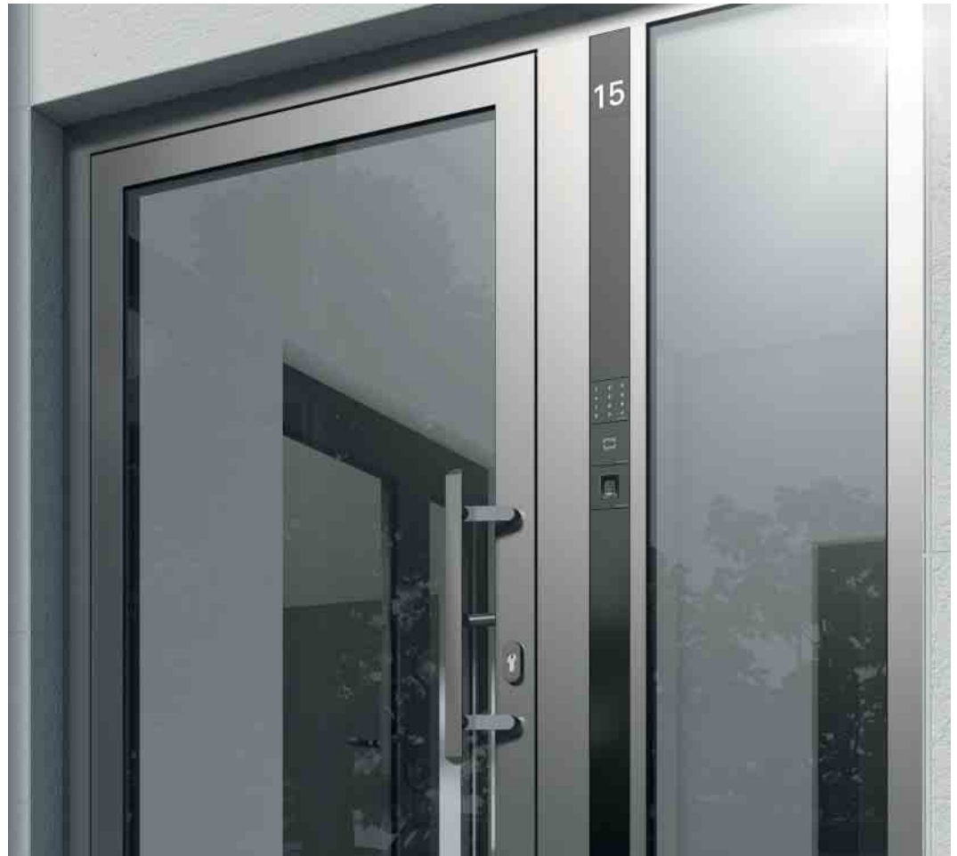
Zutrittskontrolle für alle Objekte des gehobenen Wohnungsbaus Access control for any luxury home

Bei der Zutrittskontrolle bietet Schüco individuelle Lösungen für den gehobenen Wohnungsbau und für Gewerbeobjekte. Für kleinere gewerbliche Objekte gibt es eine „Stand-alone-Variante“ mit Masterzugang. Die Module Kartenleser, Tastatur und Fingerprint sind als Systemkomponenten leicht austauschbar. Die personenbezogene Hinterlegung unterschiedlicher Aktionen ist möglich.